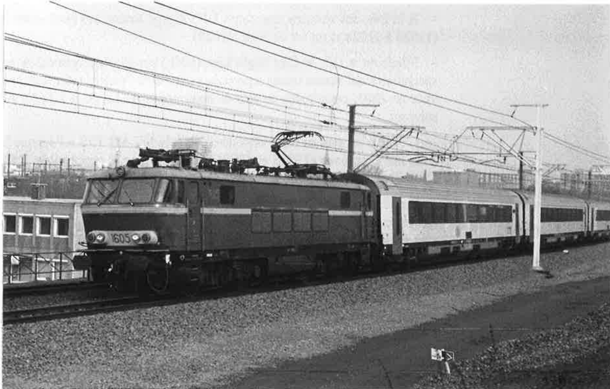
Le 12/12/02 l'une des dernières rames tractées Cologne-Ostende passe à Forest au crochet de la 1605