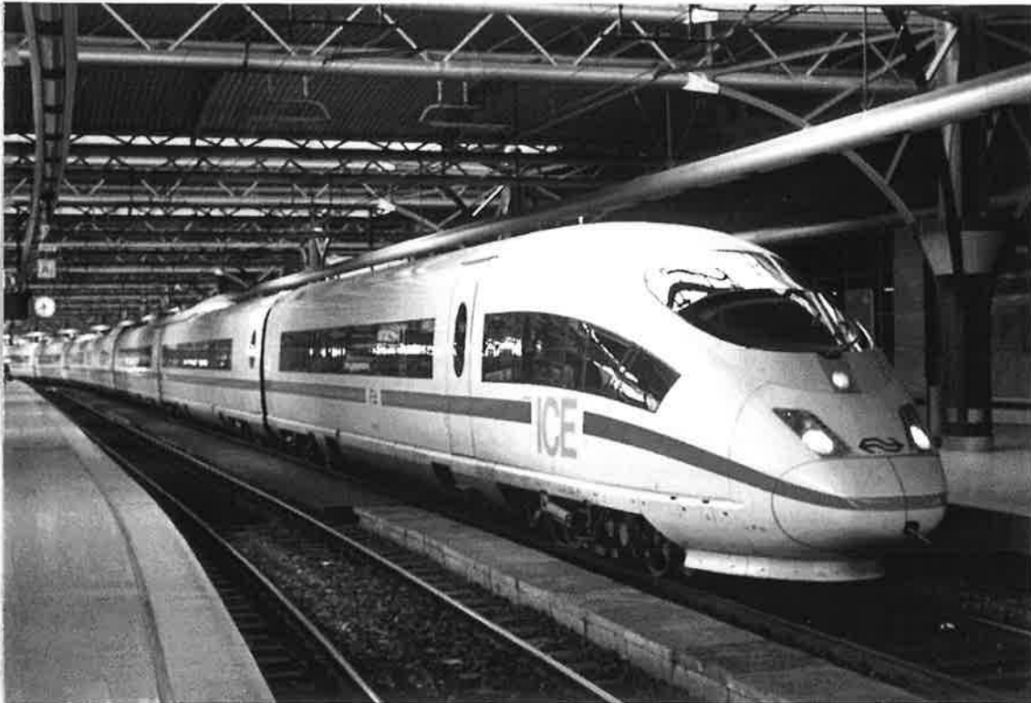
Depuis le 15/12/02, un ICE3 de la DBAG assure trois A.R. quotidiens entre Bruxelles et Francfort. Le mardi 28/02, le service était assuré par une rame des NS, apparemment entrée dans le pool!